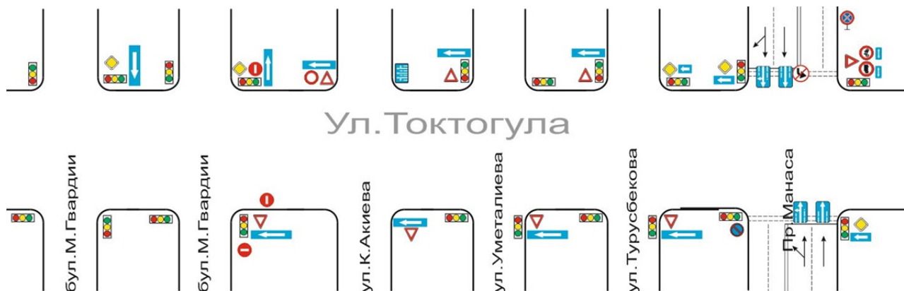
Рис. 2. Схема участка улично-дорожной сети по ул. Токтогула г. Бишкек

интенсивность, плотность, скорость и состав. Данные характеристики имеют между собой пропорциональную зависимость. Производится расчет следующих загрязняющих веществ: оксида углерода - CO ; углеводородов - CH ; оксидов азота - NO_k (в пересчете на NO_2 ); твердых частиц (сажа) - C ; диоксида серы - SO и др. Во-первых, составляется в масштабе схема участка улично-дорожной сети (рис. 2). Данный участок содержит перегоны и перекрестки со своими геометрическими размерами. Во-вторых, производится расчет выбросов загрязняющих веществ отдельно для перегонов и перекрестков.