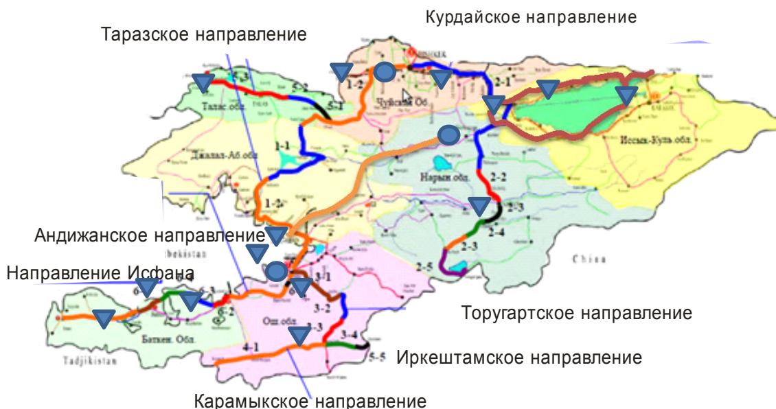
Рис. 1. Международные транспортные коридоры КР.

Строительство логистических центров должно производиться вблизи международных трасс Великого шелкового пути (рис. 1). Именно там с точки зрения логистики в будущем будут сосредоточены грузопотоки, связывающие Восток с Западом, Ближним Востоком, с Средиземноморьем, Россию с странами Южной Азии. Как и владельцы древних караванов, грузоперевозчики ищут кратчайшие пути для доставки своих товаров. И эти пути проходят через Кыргызстан.