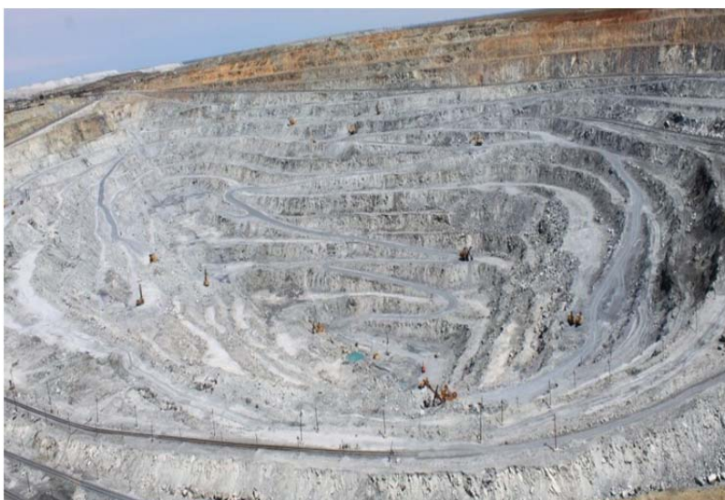
Рис. 3. Карьер Киембаевского месторождения Ясненского городского округа

Вблизи города Ясный на востоке области расположено Киембаевское месторождение хризотил-асбеста (рисунок 3). Оно является крупнейшим не только в нашей стране, но и в мире.