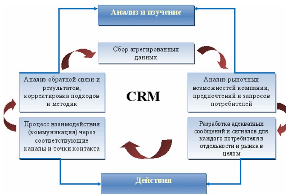
Рис.2. Общие процессы функционирования CRM-системы

Наиболее общие процессы функционирования CRM-системы представлены на рис.2.