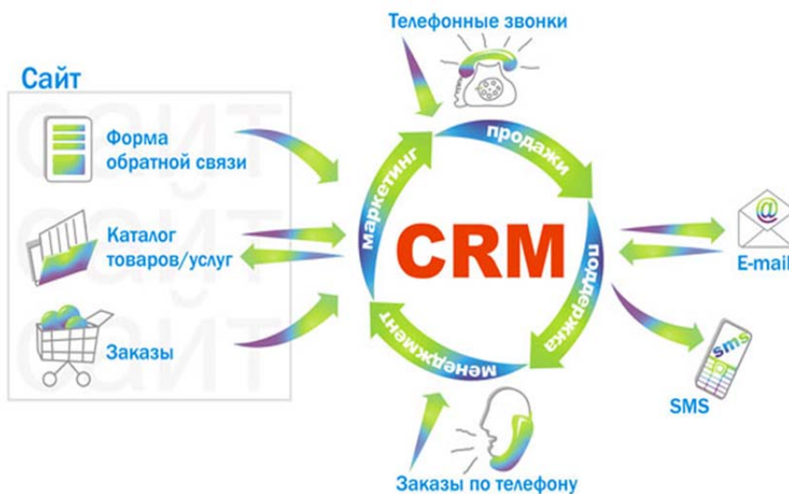
Рис.1. Общая схема взаимодействия CRM-системы

В настоящее время для учета клиентов и сделок разработаны CRM-системы. CRM-система – это «Customer Relationship Management System», то есть «Система управления отношениями с клиентами». Отличительной особенностью CRM-систем является то, что в них, в отличие от Excel, для хранения данных используются не огромные таблицы, а удобные карточки, в которых представлены и данные о клиентах, и вся информация, относящаяся к данному заказу с момента его поступления до исполнения [8]. Система сохраняет все телефонные разговоры, поддерживает связь посредством e-mail и SMS, позволяет подготовить документы, выставить счет, поставить себе напоминание, например, согласовать план мероприятий (рис. 1).